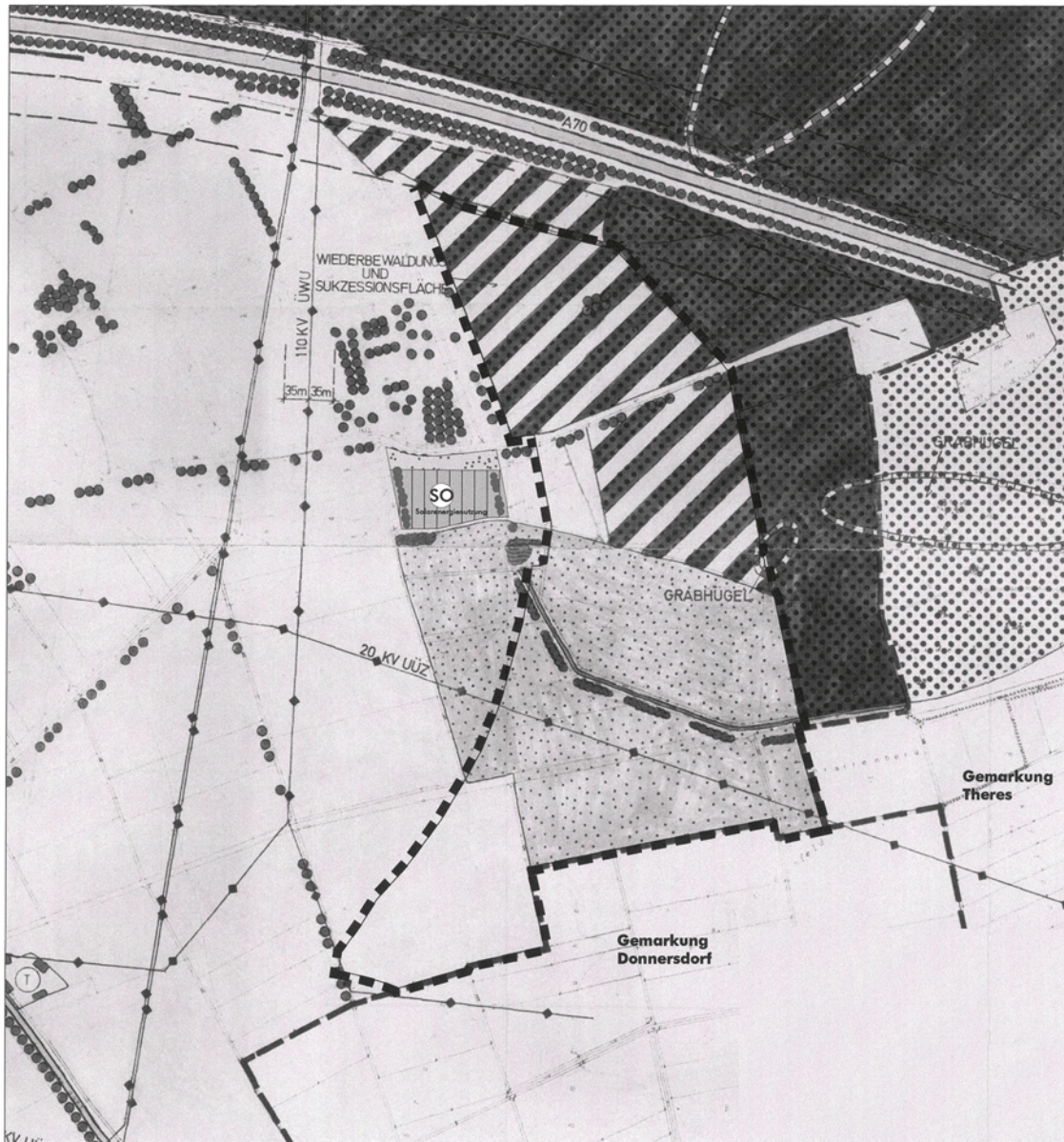
Rechtskräftiger Flächennutzungsplan in der Fassung der 6. Änderung