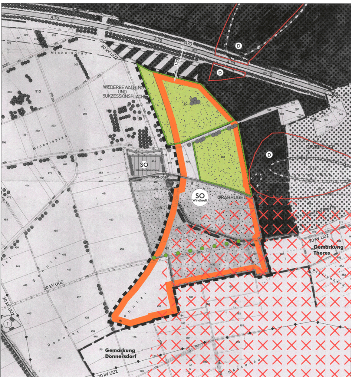
7. Änderung des Flächennutzungsplans