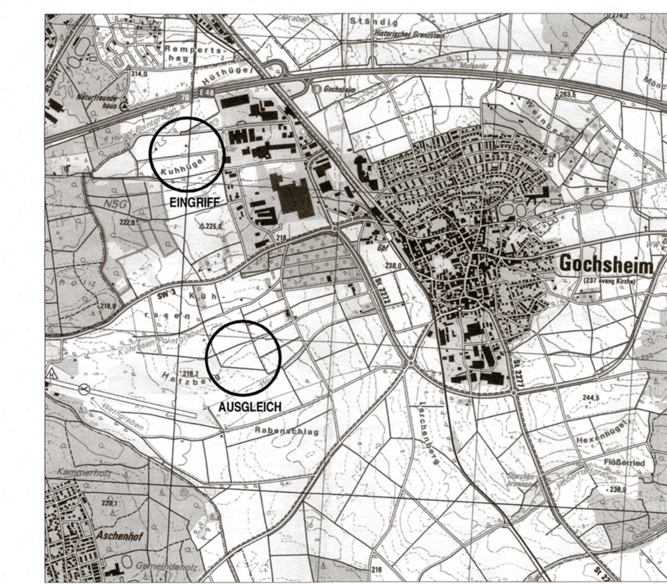
ÜBERSICHTSLAGEPLAN M = 1:25.000